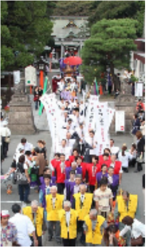
健康長寿行列の様子

六十歳代の方は赤色袴風羽織、七十歳代の方は紫色袴風羽織、八十歳以上の方は黄色袴風羽織と色分けし、健康長寿を御祈願いたしました。