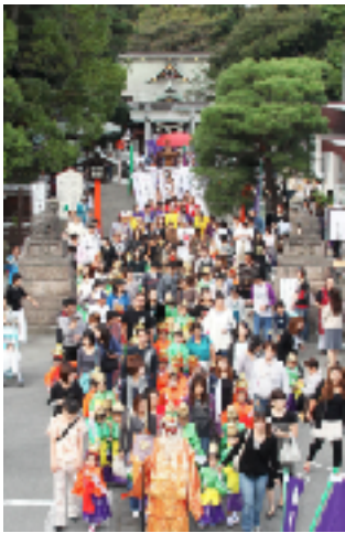
参道の稚児の様子

七十二名のお子様に参加して頂き、子育て八幡さまの御神徳を頂き、お子様の心身健やかなる成長と御守護を御祈願致しました。