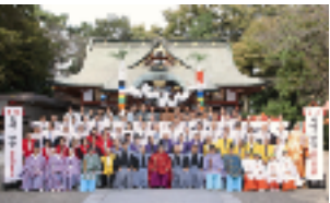
社殿前で集合写真

日光例幣史道の国道三五四号を皆様にご協力頂き片側通行止めとし、玉村小学校前を左折した後、神社へと巡幸致しました。神幸祭終了後、燈籠宵まつりに於いて、上州雅楽会の奉納演奏会を行いました。