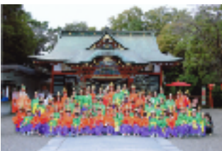
社殿前で集合写真